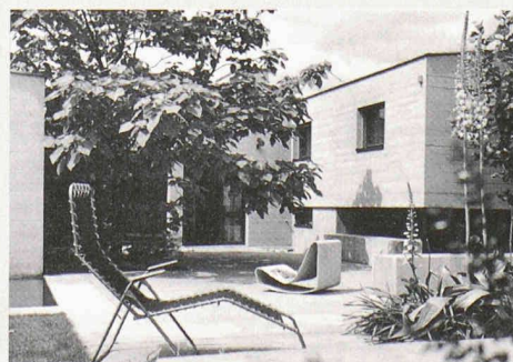
Garten Schmidlin, 1967