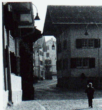
Neuer öffentlicher Raum in beiderlei Wortsinn: die nach dem Bau der Ortsumfahrung zurückgebaute Hauptstrasse im glarnerischen Rüti

Das Programm löste im Dorf einen intensiven Meinungsbildungsprozess über die Strassenraumgestaltung aus und schuf damit öffentlichen Raum im städtebaulichen wie im soziologischen Wortsinn. Nun zieht die neue Lebensqualität neue und jüngere Bewohner an, die wiederum die sozialen Strukturen der einkommensschwachen Gemeinde beleben.