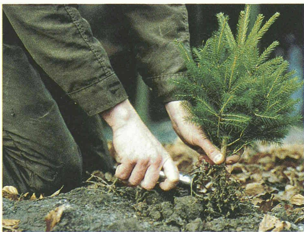
Fortbildung im Wald – Teil nachhaltigen Handelns