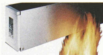
Mehr Sicherheit im Brandfall mit feuerwiderstandsfähigem Installationskanal-System FWK

Wenn in den Medien von Brandkatastrophen berichtet wird, stellt sich in der Öffentlichkeit häufig die Frage nach der technischen Schutzausstattung der betroffenen Gebäude. Überall dort, wo viele Menschen zusammenkommen, sind Lösungen für die Elektroinstallation erforderlich, die den Anforderungen des vorbeugenden Brandschutzes gerecht werden. Geeignete Systeme können im Ernstfall wesentlich zur Rettung von Leben beitragen. Für den Schutz elektrischer Leitungen entlang von Flucht- und Rettungswegen gibt es von Tehalit das feuerwiderstandsfähige Installationskanal-System FWK. Das Programm wurde in Zusammenarbeit mit Experten und Behörden entwickelt und entspricht den Bestimmungen und Normen des vorbeugenden Brandschutzes. Im Brandfall verlängert es die Funk-