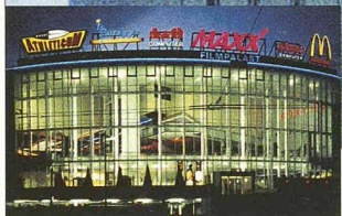
MaXX Filmpalast Emmenbrücke

Dahinter steckt unsere Liebe zur Präzision.