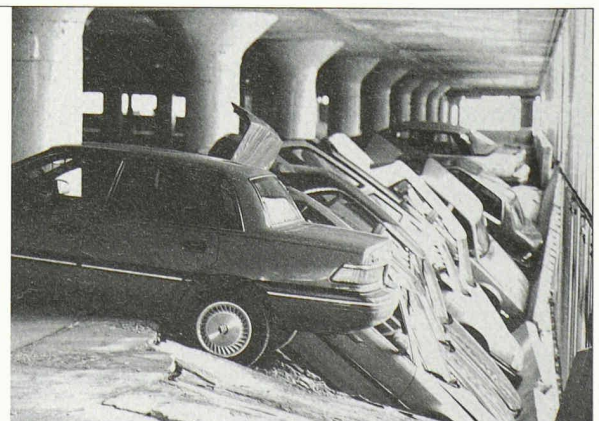
Durch Korrosion zerstörte Bewehrung

Telefax 01-980 29 93 e-mail info@baueringenieure.ch www.baueringenieure.ch