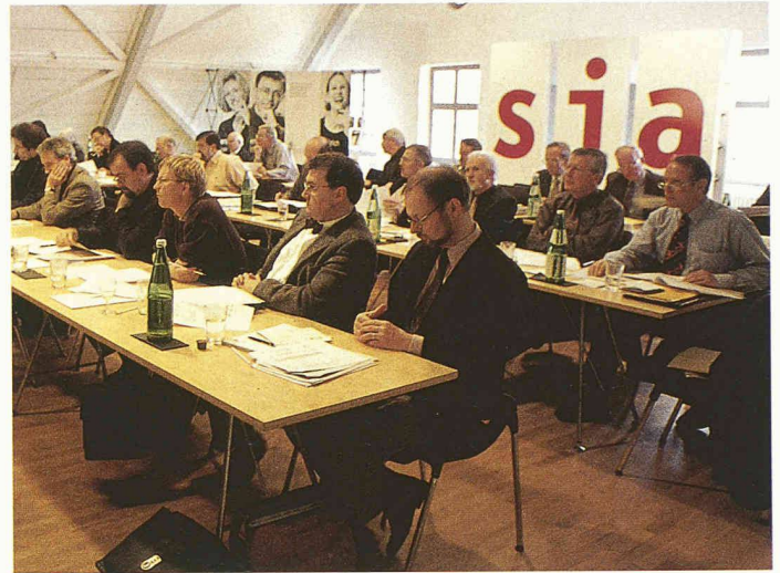
Delegierte SIA im Design Center Langenthal

Das Budget des SIA für das Jahr 2001 war an sich nicht bestritten. Hingegen gab der Antrag aus der Sektion Zürich zu reden, welcher verlangt, dass jene Einzelmitglieder, die älter als 65 Jahre sind, vom Jahresbeitrag befreit werden sollen. Sie hätten aber einen Anteil von 90 Franken an das Abonnement der Zeitschrift tec21 zu bezahlen, sofern sie diese weiterhin zu erhalten wünschen. Wer will, kann gemäss diesem Antrag weiterhin Einzelmitglied bleiben und damit weiter alle Leistungen beziehen. Dieser Antrag wurde durch die Versammlung gutgeheissen. Knapp verworfen hingegen wurde ein Antrag aus der Sektion Innerschweiz, den Jahresbeitrag für die neu geschaffene Partnermitgliedschaft von 500 auf 1000 Franken zu erhöhen. Zudem wurde verlangt, genügend Mittel für korrekte Übersetzungen in die französische Sprache einzusetzen. Letzteres ist – wie Erfahrungen zeigen – weniger eine Frage des Budgets als vielmehr der Qualitätssicherung. Deshalb wird sich eine Arbeitsgruppe des Problems annehmen. Insgesamt wurde das Budget einstimmig gutgeheissen.