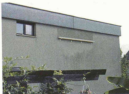
Oben links: Erhaltung der Durchschlupföffnung im Zuge der Dachsanierung Oben rechts: Bauwerke können auch zu Fallen werden: im Innenraum dieses Brückenpfeilers verirrt sich Fledermäuse. Dieses Problem wurde mit einem Fledermauskasten im Innern behoben Unten: Eine neu eingesetzte Etegranplatte mit einer Auffangvorrichtung erlaubt eine leichte Reinigung von Kot und Urin. Die schwarzen Verfärbungen um die Platte sind allerdings auf die Luftverschmutzung zurückzuführen

ren, die sich im verbauten, intensiv genutzten Siedlungsraum zurechtfinden und uns unmittelbar vor der Haustüre spannende Erlebnisse bieten.