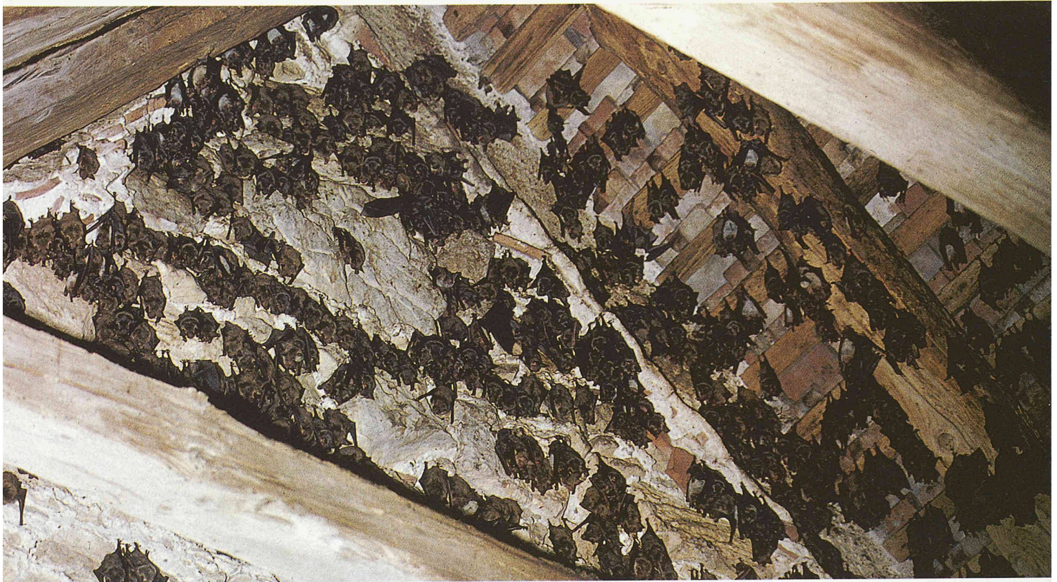
Kolonie Grosser Mausohren in einem Estrich

Fledermäuse können mit ihren Zähnen und Füßen am Gebäude nichts zerstören, und auch der Kot der Tiere führt nicht zu Bauschäden. In seltenen Fällen, vor allem bei schlechter Bauweise oder der Verwendung von billigen Baumaterialien, können kleinere Verputzschäden oder Fassadenverfärbungen durch den Urin einer sehr grossen Kolonie verursacht werden. Diese Probleme lassen sich baulich einfach beheben.