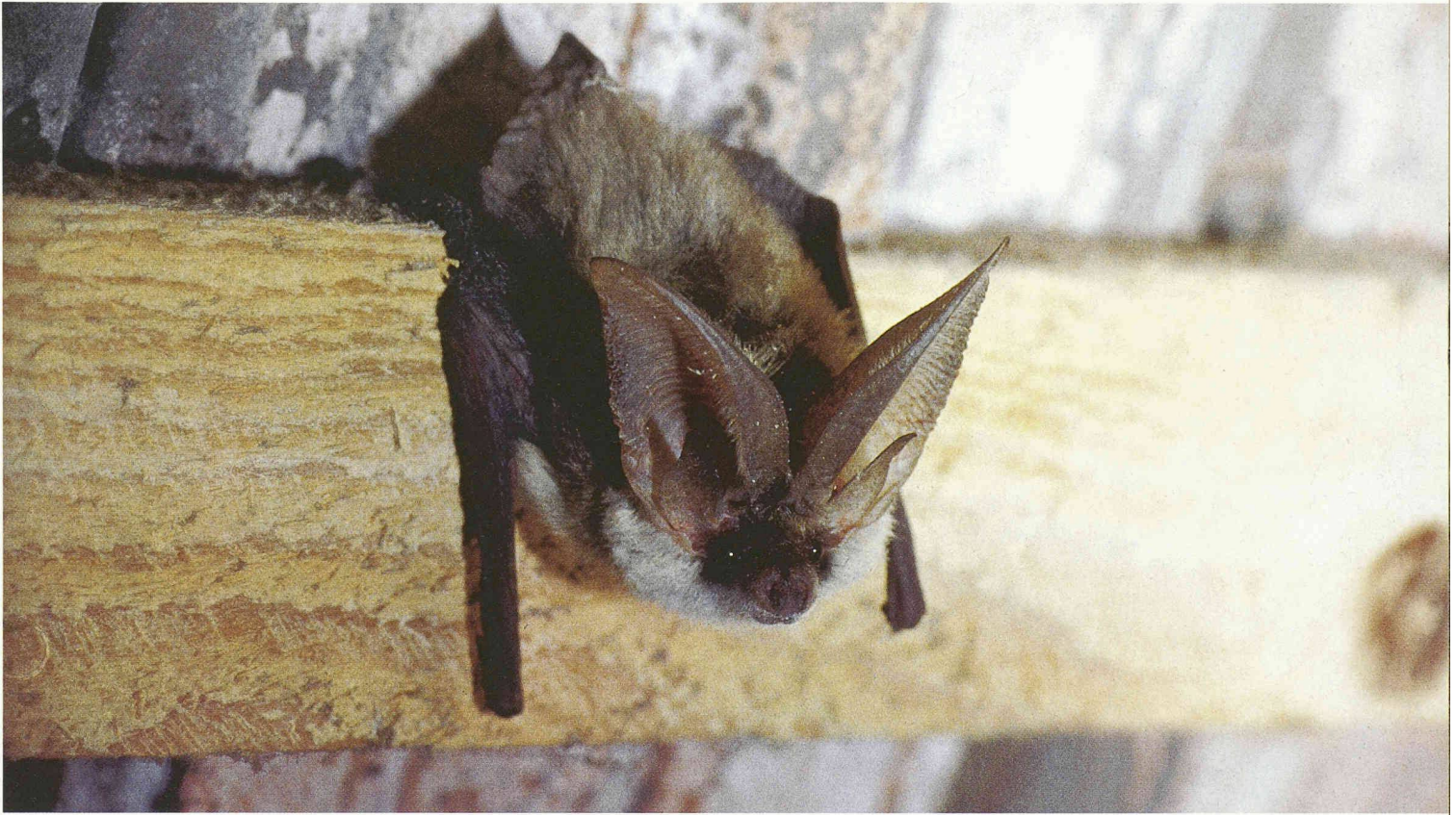
Graues Langohr in einem Estrich