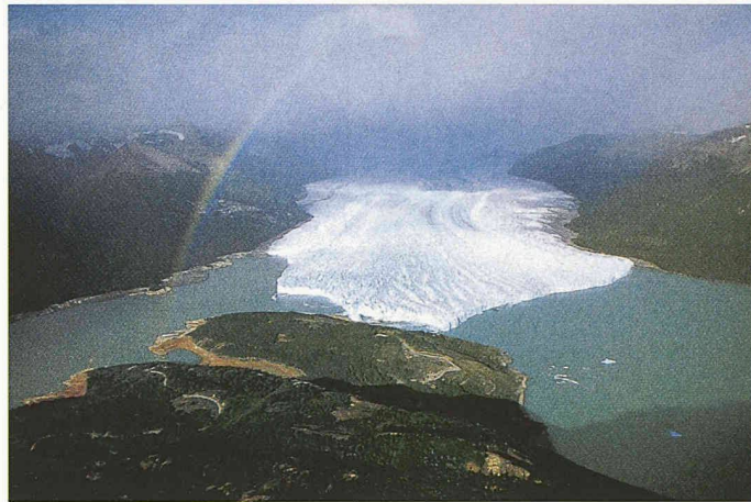
Perito-Moreno-Gletscher, Patagonien (links)

Die Websites www.3sat.de und www.swr2.de halten neben den Programangaben weitere Informationen und Links zu Frisch (auch als Architekt) bereit.