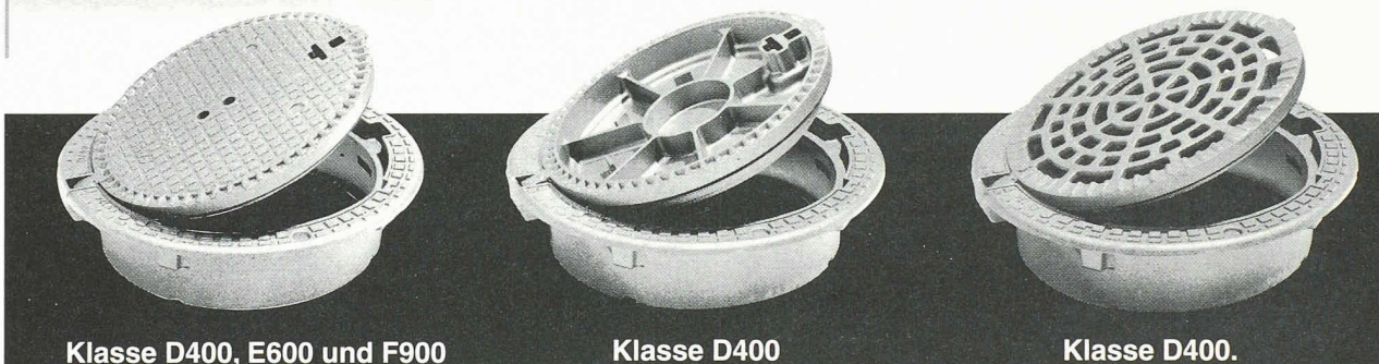
Klasse D400, E600 und F900

mit oder ohne Verriegelung (mit oder ohne Belüftungslöchern in D400).