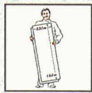
Leicht zu verlegen