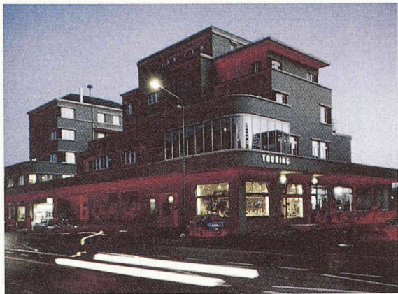
Nach der Sanierung: das «Touring» by night

Ebenso interessant wie der Bau selbst waren dessen spätere Nutzungen unmittelbar nach dem Zweiten Weltkrieg, als die amerikanischen Besatzungssoldaten die grosse Tanzterrasse im Obergeschoss mit Jazzklängen erfüllten und ein Stockwerk tiefer ein junger Automobilingenieur seine Prototypen entwickelte. Die handliche Publikation mit vielen Abbildungen kostet Fr. 38.- (plus Versandkosten).