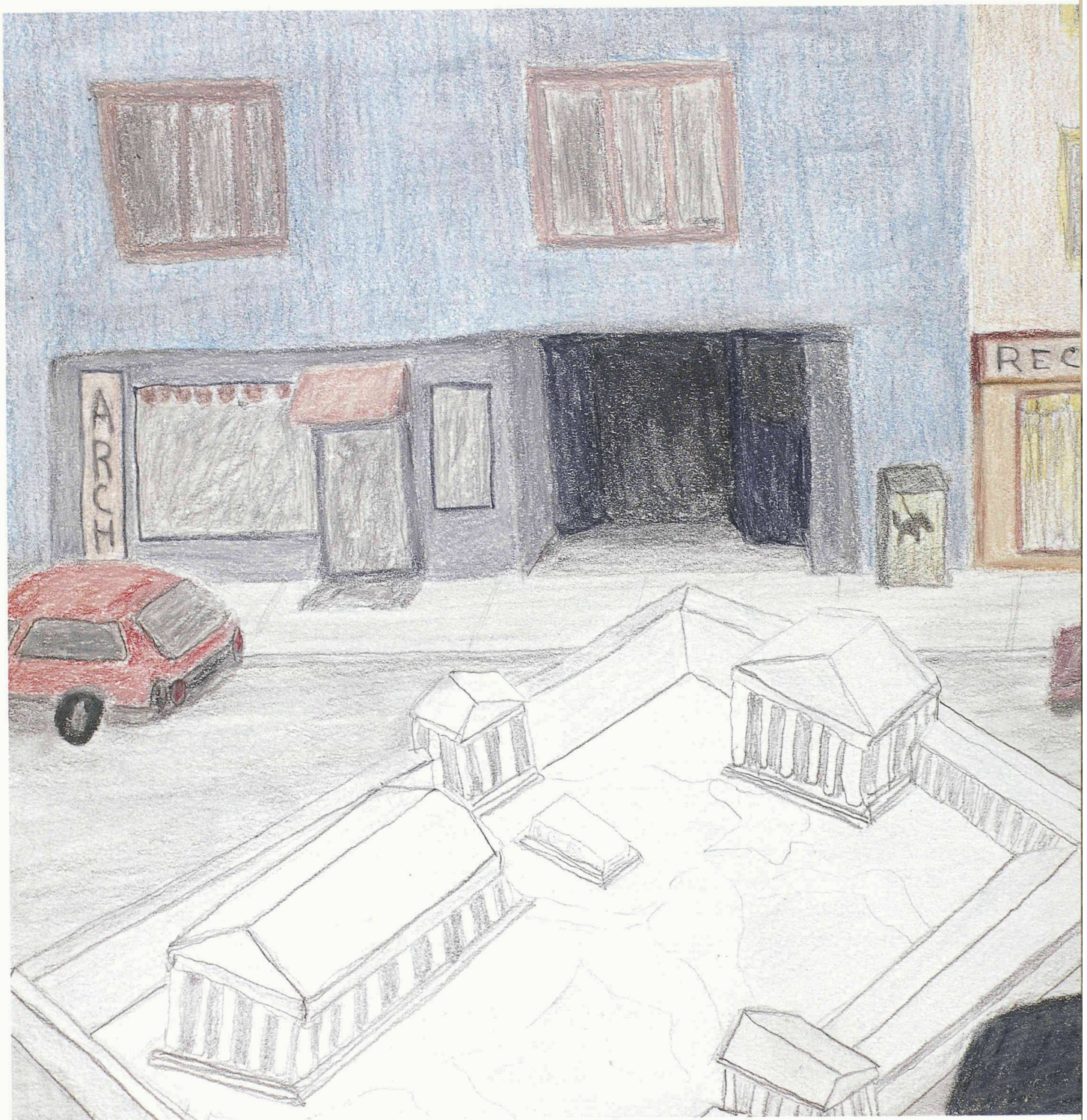
Zeichnungen von David Chieppo