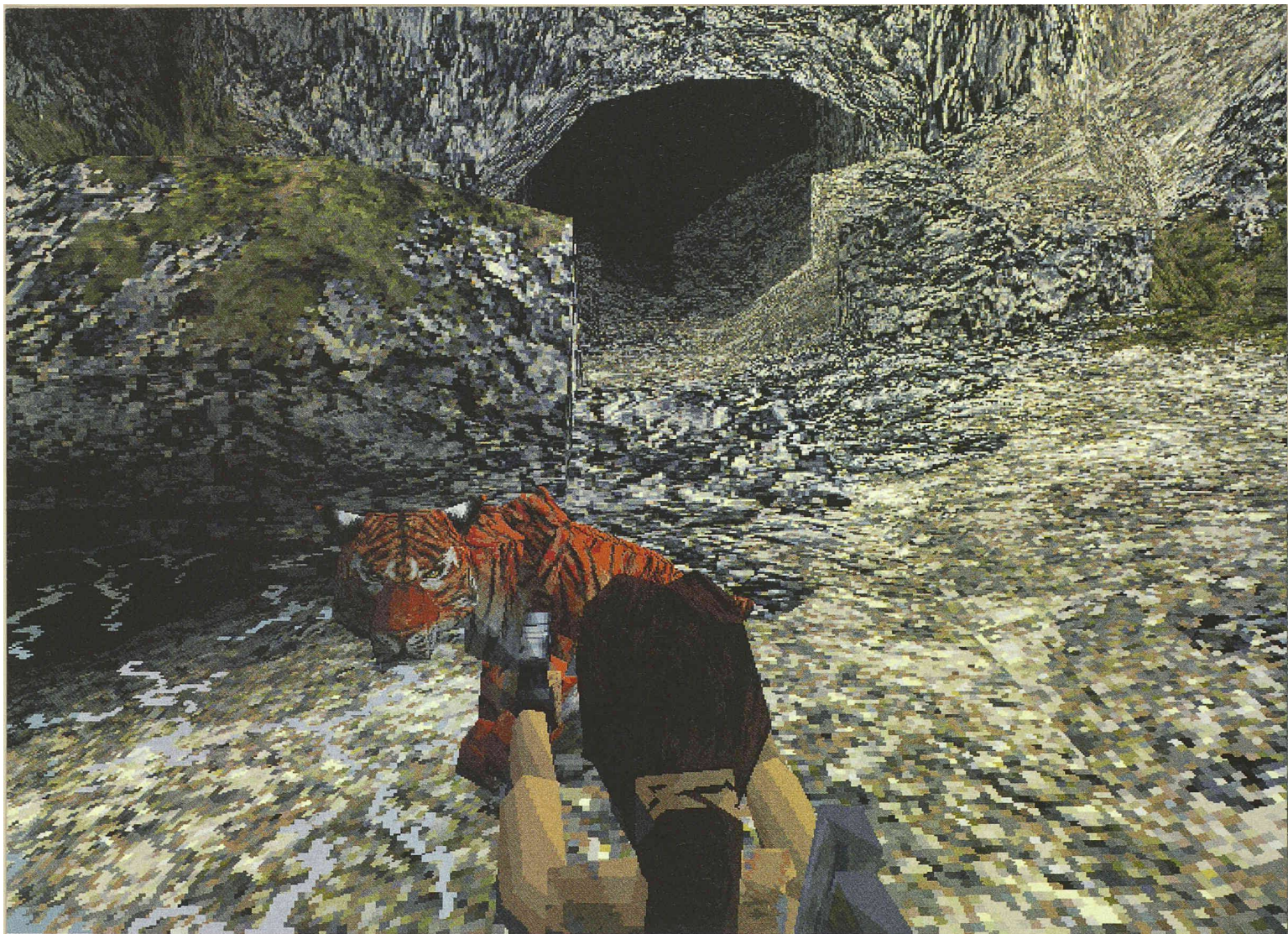
Lara und Dante vor feindlich gesinnten Raubkatzen (aus TR II und aus Gustave Dorés illustrierter «Divina Commedia», Inferno, Blatt II)