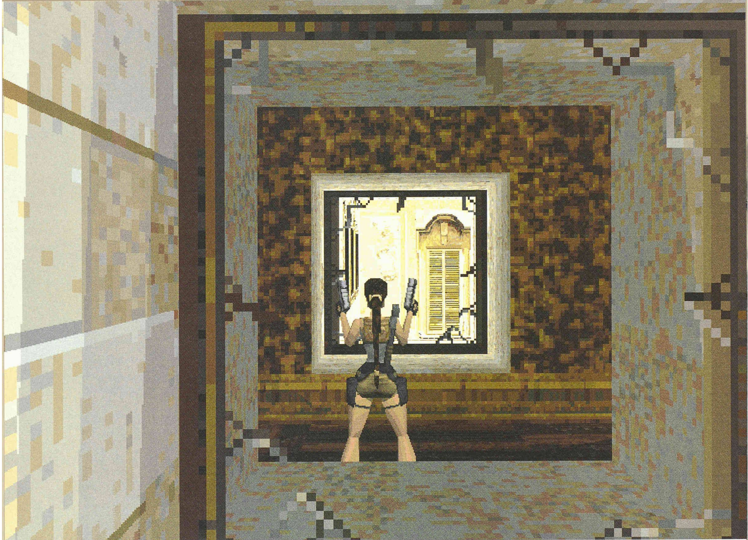
«Frau am Fenster» von Caspar David Friedrich. «Frau durchs Fenster» aus Tomb Raider

und die vergangene Geschichte kann nicht ruhen. Die Form der Ruinen bietet Widerstand und bestimmt den Spielrhythmus. Zusammengestürzte architektonische Teile erschweren die Wegführung, unterstützen Irrtümer und lassen durch Verlangsamung oder durch sprunghafte Beschleunigung Unvorhergesehenes geschehen.