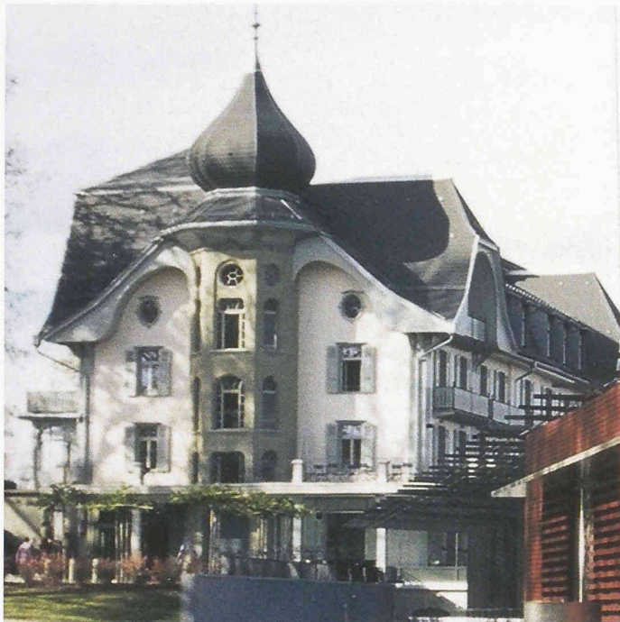
Das ehemalige Kurhotel Gurten-Kulm auf dem Gurten bei Bern ist dank Restaurants und Kulturangebot wieder ein Ausflugsziel. Der geschichtsbewusste Umbau zum Kulturzentrum wurde mit der Auszeichnung «Goldenes Dach» honoriert

In der Kunsthalle soll es künftig vier Ausstellungen im Jahr geben. Dabei sollen auch Randbereiche der Kunst mit einbezogen werden.