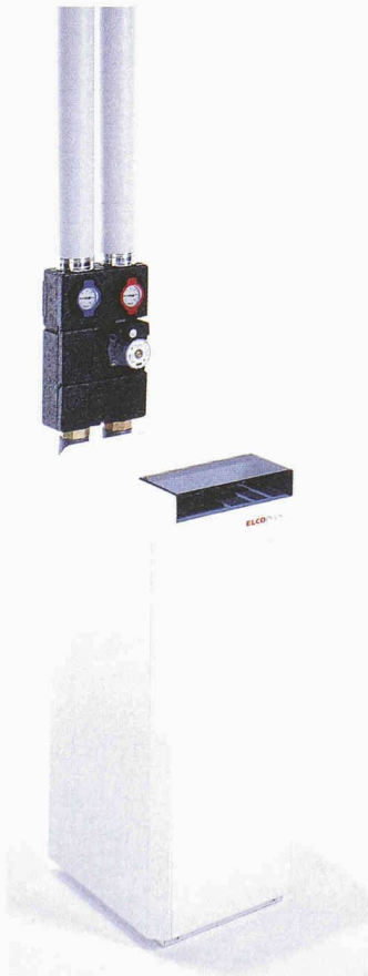
Die Elcoplus Erdsonden-Wasser-Wasser Wärmepumpe Aquatop von Elcotherm mit einer Heizleistung von 5–22 kW

Elcotherm AG 8810 Horgen 01 727 91 91 www.elcotherm.ch Halle 3.0, Stand E 10