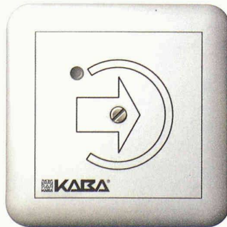
Kaba elologic – eine einfache und kostengünstige Zutrittskontrolle

Fluora Leuchten AG 9101 Herisau 071 353 06 06 www.fluora.ch Halle 2.2, Stand G 25