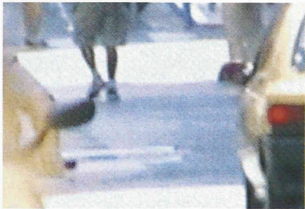
Poetische Atmosphäre im urbanen Gefüge

Patchwork-Landschaften ohne Bestand, Städte, die in unserer Vorstellung zerfliessen: Mit ihrer gemeinsamen Arbeit thematisieren Corina Rüegg und Ursula Bachman diese «Zwischenstädte», die lebensräumlichen Spannungsbereiche zwischen Innen und Aussen in den ausufernden Zwischenzonen heutiger Metropolen.