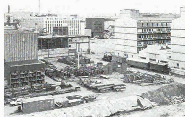
Lauf der Zeit: vom Agrargebiet übers Industrie- zum gemischten Stadtquartier