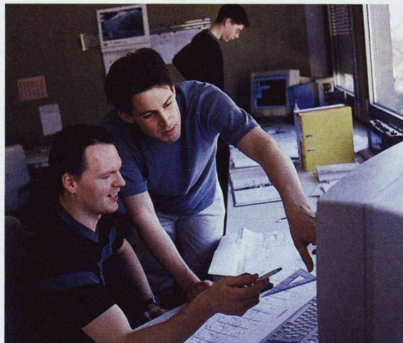
Die Zeichnerausbildung befindet sich im Umbruch. Das neue Berufsbildungssystem öffnet viel versprechende Perspektiven

Wie Eric Mosimann, Generalsekretär SIA, anlässlich des Treffens in Zürich ausführte, ist die künftige Ausbildung in den Zeichnerberufen auch vor dem Hintergrund der aktuellen Diskussion um das künftige Bachelor- und Mastersystem in den Hochschulen zu sehen. Mosimann stellte fest, dass die Zeichnerberufe dann wieder attraktiv sein werden, wenn auch die «Durchlässigkeit» in Bezug auf eine weiterführende Ausbildung klar aufgezeigt wird. Generell bildet die Lehre eine Grundlage für das berufliche Weiterkommen. Die begabten und ehrgeizigen Berufsleute sollten nicht einfach in andere Bereiche umschwenken müssen, um weiterzukommen. Die Branche sollte vermehrt darauf achten, sich den Berufsnachwuchs möglichst zu erhalten. Nebst der breiten Basisausbildung und der Spezialisie-