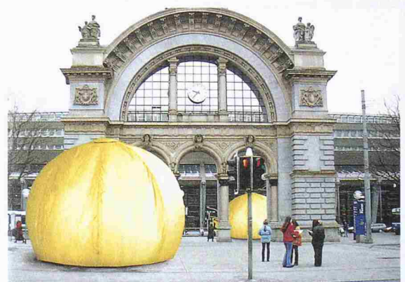
Modell eines «Chat-Bubble» (Bild: Spielraum – Stiftung Wohnkultur; Fotomontage)

begeh- und erlebbare Wohnvisionen der Zukunft. Ziel der interaktiven und auch als Bühne für Live-Aktionen dienenden Rauminstallationen ist es, das Publikum für neue Wohnformen zu sensibilisieren und die persönliche Lebensqualität durch das Interesse für das Thema Wohnen zu steigern. Bestaunt werden können beispielsweise 6 m hohe «Bubbles», Kunststoff-Konstruktionen, die als Ruhezone (blau) oder als Kommunikationsorte (gelb) dienen sollen. Das Konzept der Ausstellung stammt von der Hochschule für Gestaltung und Kunst Luzern und der Hochschule für Technik und Architektur Horw.