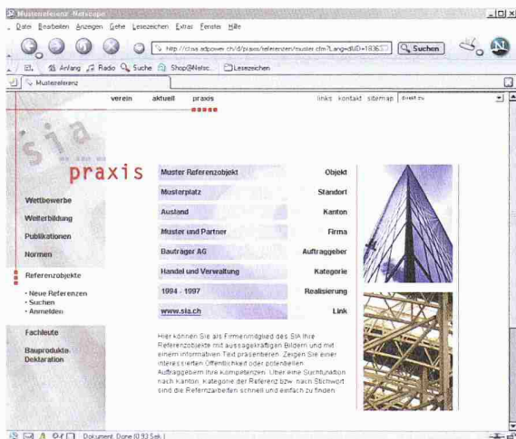
Die Homepage zeigt Referenzobjekte von Firmenmitgliedern

Das umfangreiche Verlagsprogramm des SIA umfasst nebst dem Normenwerk Vertragsformulare, Dokumentationen, Sonderpublikationen, Fachliteratur und Verinsschriften. Die Publikationen können über das Internet bestellt werden. Eine komfortable Suchfunktion