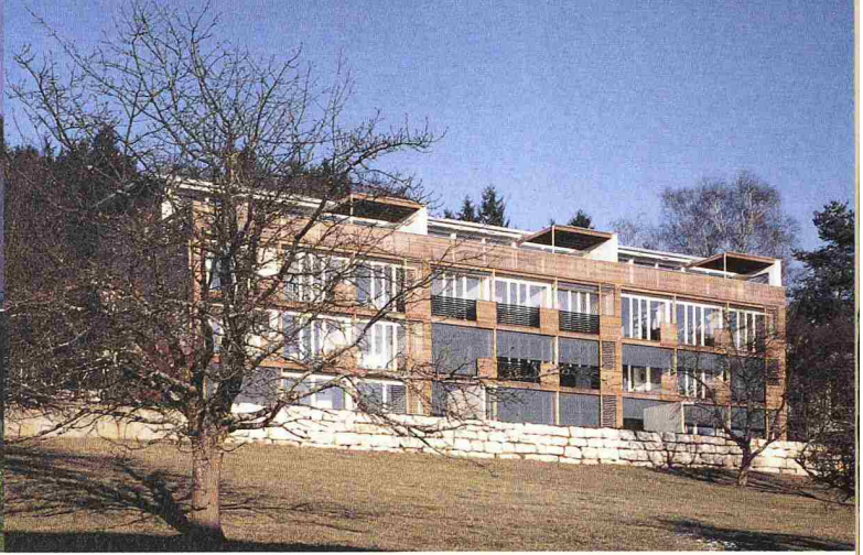
Die Siedlung Rüchlig in Stein bei Säckingen: Vorfabrikation im Passivhausbau ist machbar (Beitrag: René Birri)