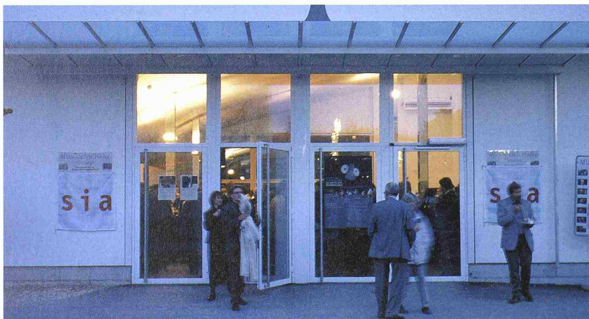
Festliche Atmosphäre im Mummenschanztheater auf der Artepilge in Biel

Mummenschanz, das sind vier Schauspielerinnen und Schauspieler, Pantomimen, Künstler. Im Hintergrund wirken Bühnentechnik und Administration. Diese Gruppe produziert Kunst – Ausdruck in Bewegung, Farbe, Form. Mummenschanz kann als bewundernswertes Netzwerk von Talenten gesehen werden. Es sind Ausnahmekönnner, die sich als Gruppe verwirklichen. Die Mitglieder des SIA hingegen sind vor allem technisch orientierte Leute, planen und gestalten die Um- und Mitwelt. Sie dürfen und wollen sich mit Künstlern