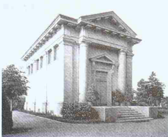
Krematorium von 1887 im Stil eines griechischen Tempels

Fragen nach der richtigen, zeitgemässen und rationellen Bestattung beschäftigten im 19. Jahrhundert die Menschen. Kontrovers diskutiert wurde die Kremation. Das Krematorium im Zentralfriedhof, das 1889 seinen Betrieb aufnahm, ist das drittälteste des Kontinents.