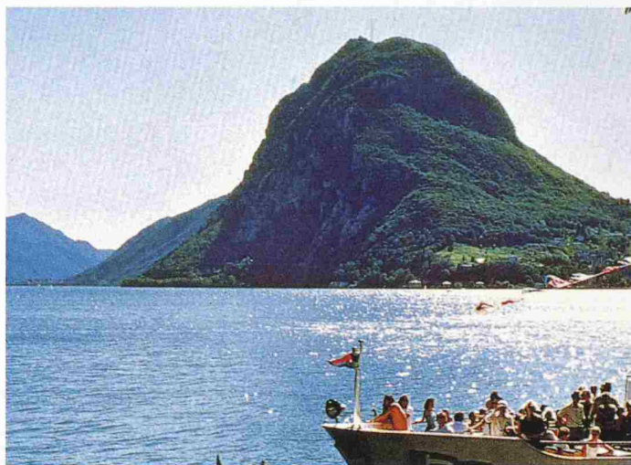
Der Monte San Salvatore bei Lugano, symbolträchtiger Tagungsort des Präsidentengipfels: Die Präsidentenkonferenz soll aufgewertet und vermehrt ein Forum für Gedankenaustausch und Diskussion werden

Aus- und Weiterbildung, Nachwuchsförderung und Forschung im Bereich der technischen Berufe sind wichtige Themen. Darüber und über das Ziel, die technische Grundausbildung zu harmonisieren, um interdisziplinäre Arbeit noch besser zu leisten, berichtete Charlotte Rey. Sie betonte die wichtige Rolle des Systems Bachelor/Master für die «Durchlässigkeit» in der Studienabfolge, welches derzeit an den Hochschulen umgesetzt wird. Der SIA stellt die Vorstellungen des ETH-Rates bezüglich einer Konzentration der Ingenieurausbildung allein auf den Standort Lausanne deutlich in Frage. Dieser Berufsstand schafft die hochstehende Infrastruktur und die technischen Systeme. Die Ingenieure können diese unterhalten, betreiben und weiter entwickeln und damit unseren gewohnten, hohen Lebensstandard erhalten. Diese Berufe verdienen deshalb die volle Aufmerksamkeit von Seite Politik und Wirtschaft und dürfen in keiner Weise marginalisiert werden.