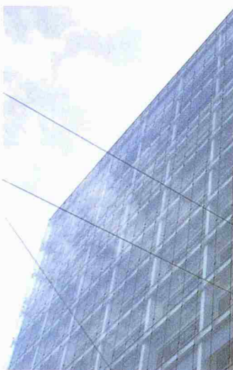
Das Mobimo-Hochhaus in Zürich: Tageslichtnutzung als Teil eines Gesamtenergiekonzepts

Die Highlights des 8. Symposiums «Innovative Lichttechnik in Gebäuden», das am 24. und 25. Januar in Staffelstein (D) stattfand, waren neue Lichtmanagementsysteme, optimierte Tageslichtnutzung und ausgeklügelter Lichttransport über Hohlleiter.