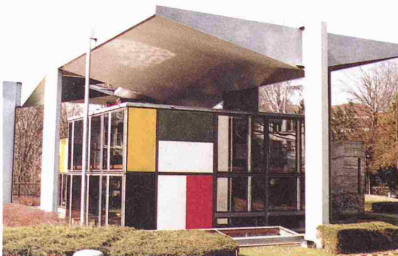
Den Betrachtern ist meist nicht bewusst, dass das Le-Corbusier-Haus in Zürich ursprünglich für eine begrenzte Lebensdauer konzipiert war