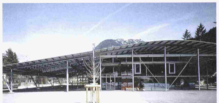
Erich Gutmorgeth, Lebensmittelsupermarkt Mpreis, Leutasch, Tirol (1998–99)

Die Ausstellung dauert noch bis 15.4.02 und ist täglich von 10 bis 19 h geöffnet.