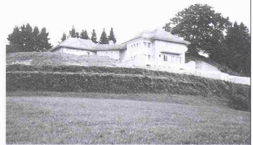
Abgrenzung zur Landwirtschaftszone in Goldingen