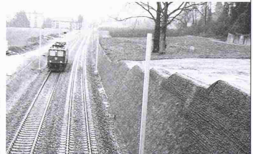
60° Steilböschung neue Doppelspur MThB Kreuzlingen.