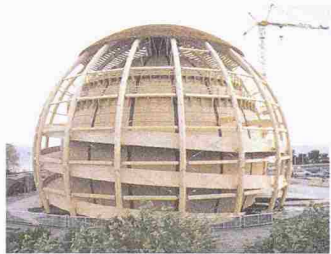
Bild: Expo.02 / Palais de l'Equilibre im Bau