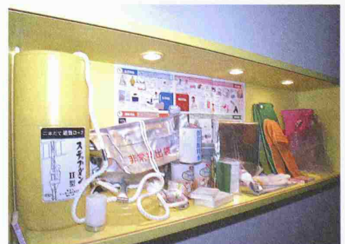
Erdbeben-Überlebenskit aus Japan

schriften. Statistisch gesehen wird die Schweiz innerhalb von 100 Jahren von rund 1000 leichten Beben ohne Schäden getroffen. Eine Modellstadt macht Gefahren für wichtige Bauten und Verbindungen anschaulich. Neben historischem und abstraktem Wissen erlauben Exponate wie ein Handrütteltisch sinnliches Erleben. Das Rahmenprogramm umfasst Führungen, Exkursionen und Vorträge. Zur Ausstellung erscheint zudem eine umfangreiche Begleitpublikation. Die Ausstellung dauert bis zum 17.11. und ist Di–So von 10–17 h geöffnet. Informationen unter www.nmb.bs.ch oder Tel. 061 266 55 00.