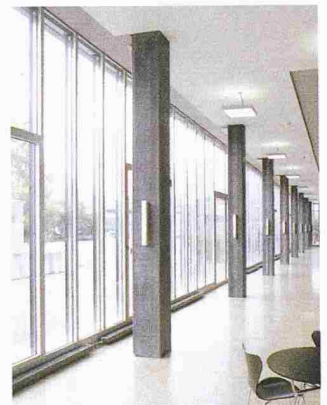
Die filigranen Stützen fördern die Transparenz des Gebäudes; Interkantonales Technikum Rapperswil

Schleuderbetonstützen ist ihre hohe Wirtschaftlichkeit. Durch den geringen Durchmesser bei hoher Tragfähigkeit werden bei gleicher Grundflächennutzung zusätzlich vermietbare Flächen geschaffen. Zudem wird der Baufortschritt beschleunigt, da die Stützen im Werk vorgefertigt werden und der Abbindeprozess somit bereits abgeschlossen ist. Beim Eintreffen auf der Baustelle sind die Stützen sofort einbaufähig und voll belastbar. Durch den Herstellungsprozess wird der Beton so stark verdichtet, dass im Verhältnis zum Durchmesser überdurchschnittlich tragfähige Betonfertigteile entstehen, die sehr schlank wirken. Dies eröffnet dem Architekten und Planer Freiraum bei der Umsetzung innovativer