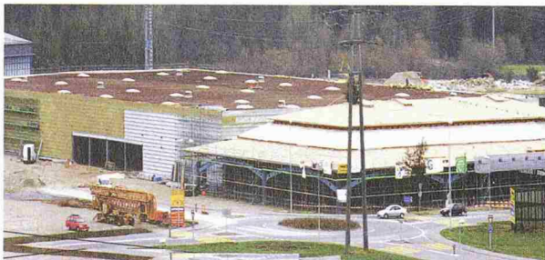
Baumarkt Hornbach AG; Architekten: Fugazza, Steinmann & Partner AG, Wettingen

Die Bauherrschaft, Planer und Unternehmer haben sich beim ersten schweizerischen Hornbach-Baumarkt in Littau für ein Sarnafil-T-Dachsystem mit Sarnavert-Begrünung entschieden. Das Dach