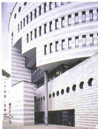
Eingangsbereich mit Schleuderbetonstütze; Botha-Haus, UBS in Basel

Schleuderbetonstützen überzeugen durch eine besonders grosse Lastaufnahme, eine absolut glatte und porenfreie Oberfläche und eine sehr hohe Passgenauigkeit. Diese Qualitätsmerkmale prädestinieren Schleuderbetonstützen für anspruchsvolle Projekte. Die hochverdichteten Bauteile können durch Zugabe von Additiven und farbigen Zuschlagstoffen sowie weissem Zement gestaltet und den architektonischen Erfordernissen angepasst werden. Ein besonderes Plus bei der Verwendung von