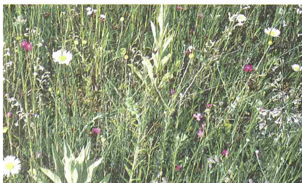
2 und 3

Verschiedene Substrate können bei gleicher Substratdicke und gleichen Ansaatmischungen zu ganz verschiedener Artenzusammensetzung führen