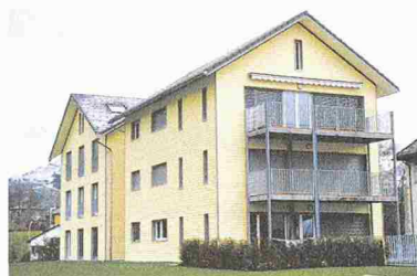
Überbauung Ziel in Appenzell; Fassade: System Outdoor-Top

Granit Systems SA 1003 Lausanne 021 323 58 15, Fax 021 323 58 19 www.granit-environment.com