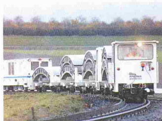
Transportlogistik des Projektes Westerschelde-Tunnel; ca. 40 000 Zugbewegungen mit 20 Loks

Die europaweit tätige deutsche Firmengruppe Dibora aus Gernsdorf bei Berlin hat Amsteg als Sitz