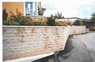
Garten- und Stützmauer Leromur

System für senkrechte und geneigte Stützmauern sowie frei stehende Begrenzungsmauern. Die Elemente von 100 cm Länge können vor