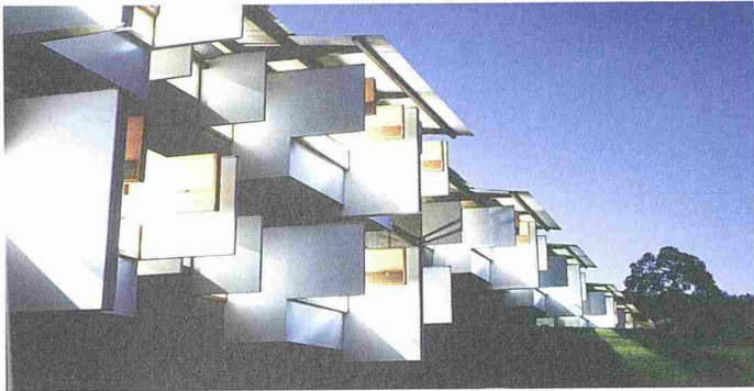
Fassade des Arthur & Yvonne Boyd Education Centre

(sda/op) Der australische Architekt Glenn Murcutt wird für sein Gesamtwerk mit dem Pritzker-Preis 2002 ausgezeichnet, der als «Nobelpreis der Architektur» gilt. Der nach der Chicagoer Hotelierfamilie Pritzker benannte Preis wird seit 1979 von der Hyatt-Stiftung verliehen und ist mit 100 000 Dollar notiert. Bisher bestätigte er nachträglich den Ruhm jener Vertreter der Architekturzunft, die in den westlichen Metropolen ein Grossprojekt nach dem anderen realisieren. So wurden letztes Jahr Jacques Herzog und Pierre de Meuron und im Jahr 2000 Rem Koolhaas gewürdigt.