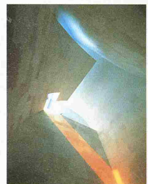
Bild links: Kiasma Museum of Contemporary Art, Helsinki, Finnland; Bilder oben und rechts: St.-Ignatius-Kirche, Seattle, Washington