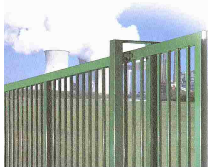
Robusta-Schiebetor von Bekaert