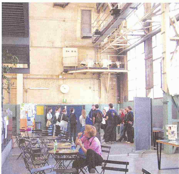
Die anregende Atmosphäre der Architektenschule in der ehemaligen Fabrikhalle beeindruckte die Mittelschüler

Imbiss in der Baukantine. Die Schüler staunten nicht schlecht, dass ein Imbiss auf einer Baustelle aus fünf Gängen bestehen kann: Salat, Suppe, Pasta, Hauptspeise und Dessert. Eine gute Mahlzeit sei sehr wichtig für die Moral der Arbeiter, erläuterte ihnen ein Ingenieur.