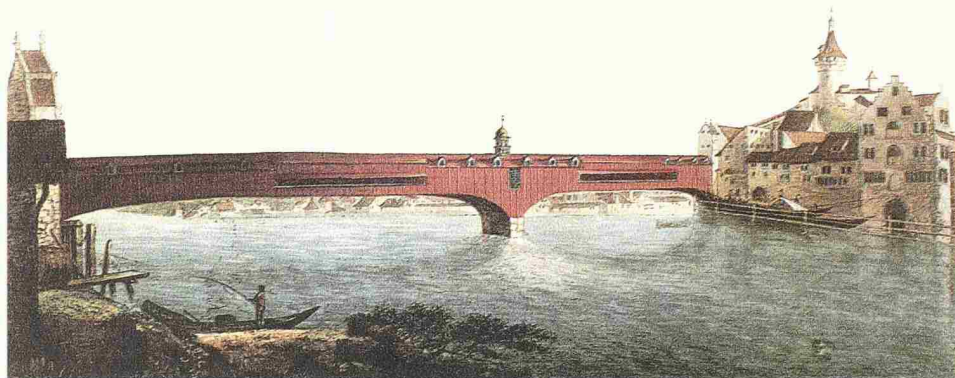
Johann Heinrich Bleuler: Brücke von Schaffhausen, ca. 1790