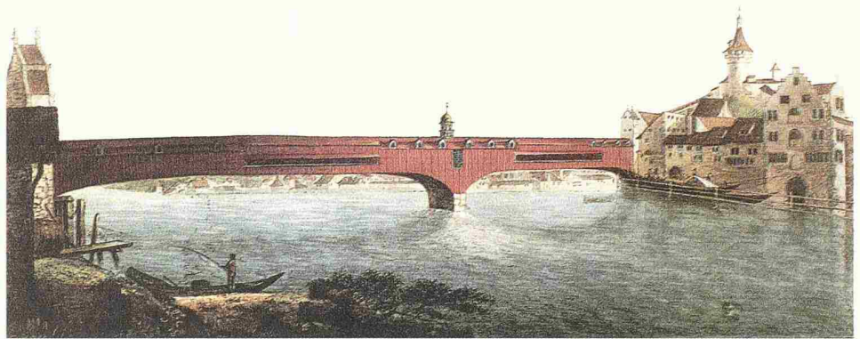
Johann Heinrich Bleuler: Brücke von Schaffhausen, ca. 1790 (Bild: Schweizerische Landesbibliothek, Grafische Sammlung, Bern)