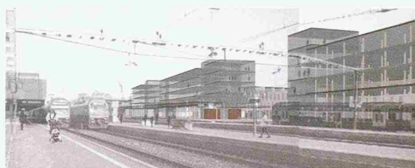
Der eher konventionelle Vorschlag des Berners Dieter Aeberhard erhielt für Illnau-Effretikon eine Anerkennung