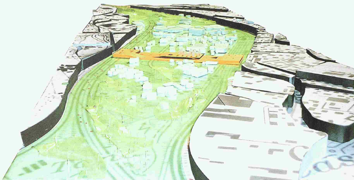
Nicht mehr als Bauwerk, sondern als Teppich mit unterschiedlichen Funktionen interpretiert der Vorschlag des Genfer Preisträgers Hybridées den neuen Bahnhof Mendrisio