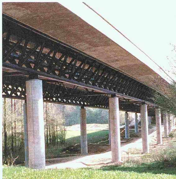
Zukunftsträchtige Konstruktion: Ein Fachwerk aus verschweissten Stahlrohren trägt die Fahrbahnplatte aus Beton bei der Autobahnbrücke von Lully (FR)