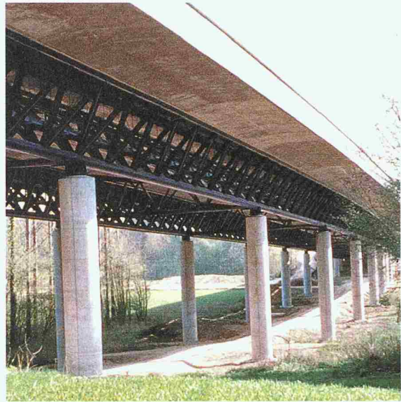
Zukunftsträchtige Konstruktion: Ein Fachwerk aus verschweissten Stahlrohren trägt die Fahrbahnplatte aus Beton bei der Autobahnbrücke von Lully (FR) (Bild aus Dokumentation SIA D 0173)