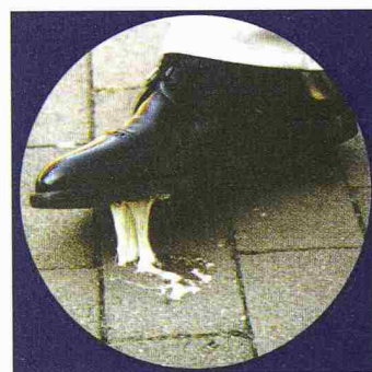
Müheloses Entfernen selbst von Kaugummis, um solch unliebsame Ereignisse zu verhindern

Desax 8737 Gommiswald 055 290 15 20, Fax 055 290 15 21 www.graffiti-schutz.ch