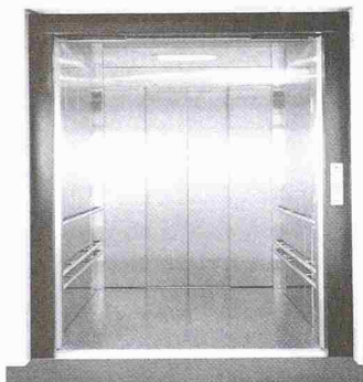
Kabine des maschinenraumlosen Aufzugsystems Lexa

AS Aufzüge AG 9016 St. Gallen 071 282 11 48, Fax 071 282 11 02 www.lift.ch