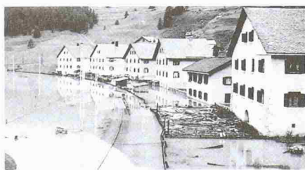
Überschwemmung des Quartiers Ariefa im südöstlichen Teil von Samedan 1951

Der Flaz, der heute kanalisiert in Samedan in den Inn mündet, erhält ein 17 km langes neues Flussbett auf der anderen Seite des Flugplatzes (hell eingezeichnet). Damit wird die Hochwassergefahr für Samedan vermindert, gleichzeitig wird die Landschaft ökologisch aufgewertet