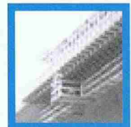
Großgerät im Tagesrhythmus umsetzen

Quick – der Spezialist im Brückenbau bietet: - Technische Lösungen, Zeichnungen und Statik, - Baustellenservice - Miete, Kauf sowie Mietkauf