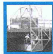
superleichte Montagebühne «Handy»