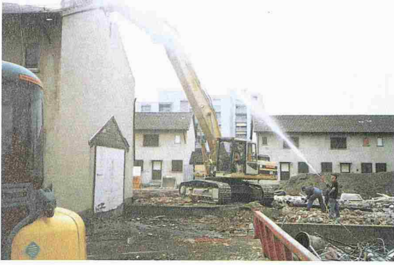
2, 3, 4 und 5

Phasen während des Rückbaus eines Mehrfamilienhauses: Ein Bagger mit Greifzange entfernt die Dachkonstruktion. Gespritzt wird, um Staubemissionen zu minimieren (2). Ein Betonbeisser zertrümmert Deckenteile, damit der Betonabbruch transportierbar wird (3). Ein Sortiergreifer klaubt grössere Mengen Bauschutt aus den Trümmern heraus (4). Ein Bagger mit Abbauhammer zerkleinert grössere Betonteile des Fundaments (5)