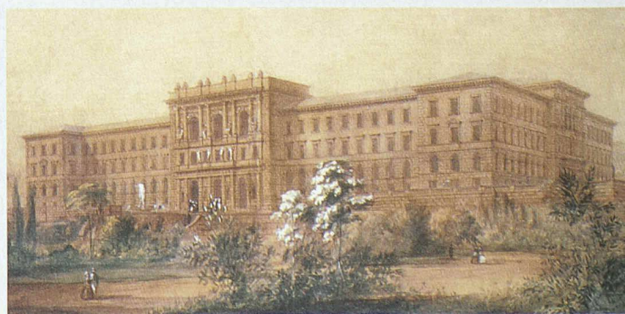
Gottfried Semper, Polytechnikum in Zürich, Perspektive von Südwesten, um 1859

Kaiserforum in Wien. Zur Ausstellung wird ein umfangreiches Begleitprogramm angeboten, das Führungen vor Ort, Vorträge und moderierte Gespräche beinhaltet. Die Ausstellung im Museum für Gestaltung in Zürich wird gezeigt vom 1. November 2003 bis 25. Januar 2004, geöffnet ist jeweils Di–Do von 10–20 h und Fr–So von 11–18 h. Weitere Infos und Details zum Begleitprogramm unter: www.museum-gestaltung.ch oder 01 446 22 11. Die kommende Ausgabe von tec21 befasst sich ausführlich mit Sempers Schaffen (Vorschau siehe Seite 37).