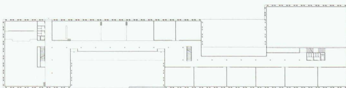
Die äussere tragende Betonstruktur ermöglicht im Innern grosse Flexibilität. Gymnasium und Grundschule sind unter einem Dach und umschliessen zwei Höfe (1. Preis, Soliman & Zurkirchen)