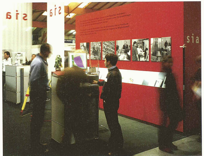
Der vom SIA gemeinsam mit den Lehrmeisterverbänden und Berufsschulen gestaltete Stand an der Bildungsmesse in Luzern vermittelte den Ratsuchenden einen guten Einblick in die Arbeit der Planerberufe

An dieser Präsidentenkonferenz wurde das Thema Berufsgesetz und Berufszulassung in drei Arbeitsgruppen aufgrund eines entsprechenden Fragenrasters diskutiert. Es zeigte sich, dass die Anerkennung von Diplomen eigentlich kaum als problematisch betrachtet wird. Hingegen sind nach Meinung der Arbeitsgruppen für die Berufe der Architekten und Ingenieure insbesondere bei der Zulassung zum Markt deutlich verbesserte Regelungen angezeigt. Zudem müssten die Berufsstände, welche unter ein Architekten- und Ingenieurgesetz fallen, entsprechend definiert werden. Unter den Begriff Ingenieur fallen zahlreiche und unterschiedliche Fachrichtungen. Der Beruf des Bauingenieurs ist dabei