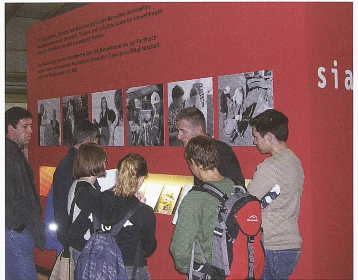
Am Stand entwickelte sich manches gute Gespräch

Vertreter dieser Berufe vor. Zwei Vermessungsinstrumente erinnerten daran, dass Planer nicht ausschliesslich im Büro arbeiten. Bei jeder Berufsgruppe standen stets ein Lehrmeister und ein bis zwei Lehrtöchter oder Lehrlinge für Auskünfte bereit. Zudem lag Informationsmaterial über den SIA, das sich besonders an die erwachsenen Besucher richtete, auf.