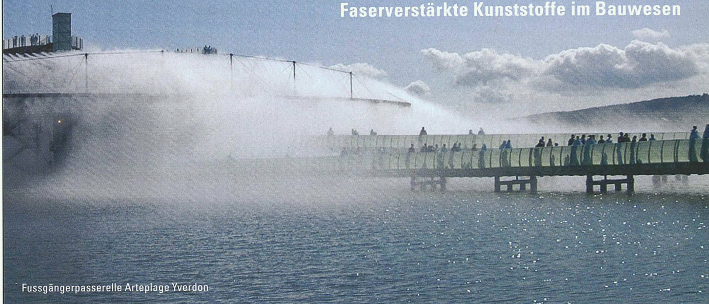
Fussgängerpasserelle Artepilage Yverdon

Beläge | Passerellen | Fassaden | Möbel | Profile