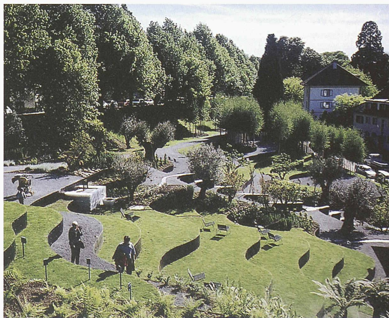
Barock anmutendes Parkett aus unterschiedlichen Buchsbaumarten im Garten der Swiss Re in Rüschlikon von Vogt Landschaftsarchitekten