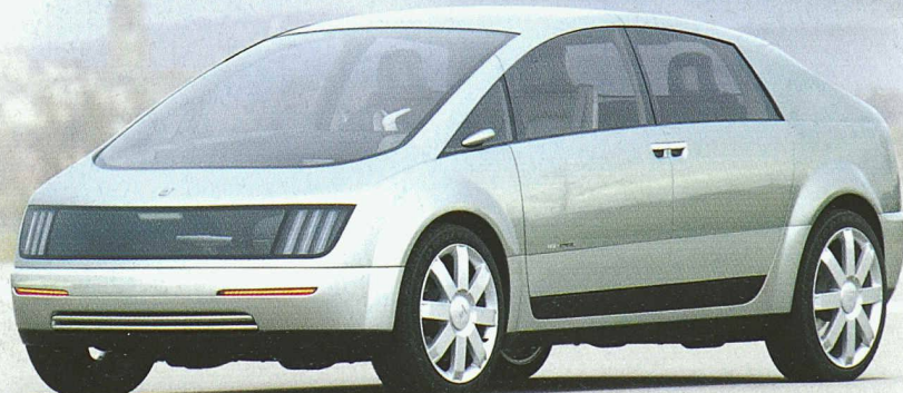
General Motors Fuel-cell-powered Hy-wire Vorgestellt an der Paris Auto Show September 2002

Die By-Wire-Technik von SKF hat wesentlich zum Erfolg mehrerer hochinnovativer Konzeptfahrzeuge beigetragen. SKF forscht und entwickelt in diesem Bereich seit über 15 Jahren und ist ein führender Anbieter von Drive-by-Wire-Lösungen, darunter von intelligenten Steuerungen für Lenk-, Brems-, Kupplungs- und Beschleunigungssystemen. Die intelligenten elektromechanischen SEMAU-Aktuatoren (Smart Electro-Mechanical Actuating Units) von SKF bieten Konstrukteuren völlig neue Möglichkeiten bei der Fahrzeugentwicklung.