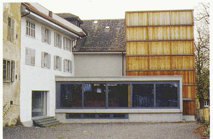
Erweiterung des Stadttheaters von 1925 durch Baumann und Rigling: Das mit Holz verkleidete Bühnenhaus erinnert an frühere hölzerne Anbauten an die Stadtmauer