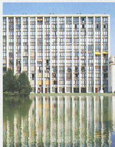
Überbauung in Meudon-la-Forêt (F), Architekt: Fernand Pouillon

kern wurde sein Gesamtwerk nun einer neuen Betrachtung unterzogen. Die Ausstellung an der Ecole Polytechnique Fédérale de Lausanne (EPFL) widmet sich Pouillons Werken in Marseille, Aix-en-Provence, Alger sowie seinen Überbauungen in Pantin, Montrouge, Boulogne-Billancourt und Meudon-la-Forêt. Die Ausstellung an der EPFL im Bâtiment SG, Ecublens, Lausanne ist geöffnet wie folgt: 3.–19.12.03 und 5.–21.1.04, jeweils Mo–Fr 8–18 h. Weitere Auskünfte erteilt die Ecole d'Architecture, Tel. 021 693 32 31.